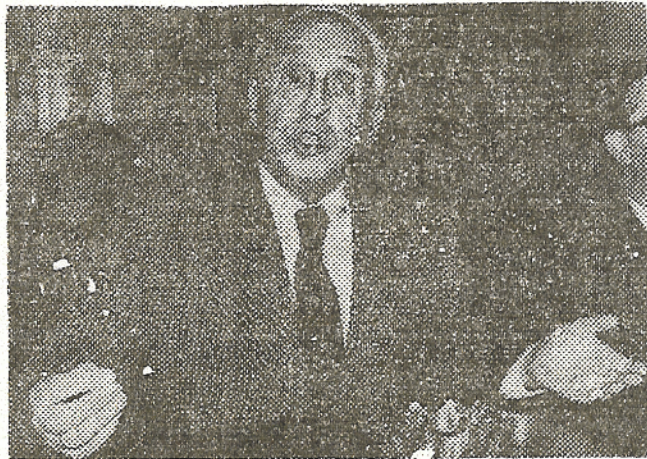
El doctor Severo Ochoa, en la rueda de prensa celebrada en mayo de 1973, y en la que se anunció su incorporación como director del Instituto de Biología Molecular. Meses después, tras el cambio ministerial, renunció a dicho cargo, volviendo a los Estados Unidos. Ahora parece que se podría volver a la idea original

Por nuestra parte, podemos indicar que puestos al habla con el Instituto de Biología Molecular en Madrid, se nos dijo que respecto a un posible regreso del doctor