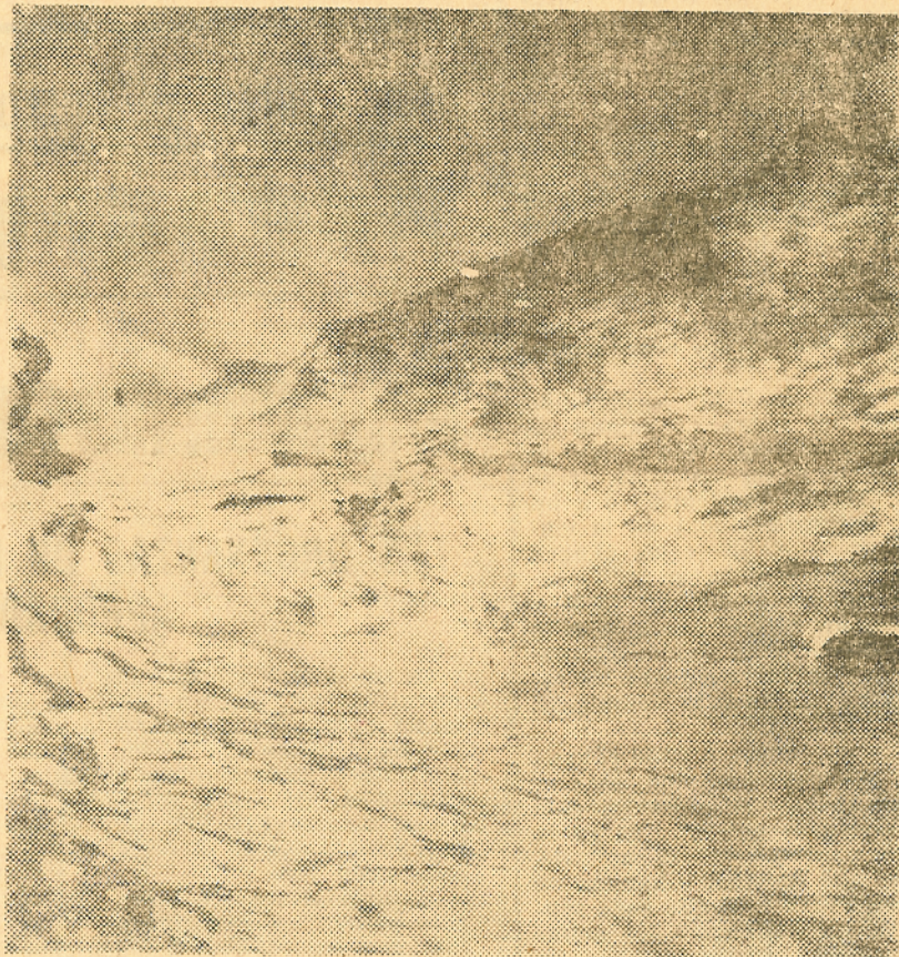
La ballena gris, hoy abundante en las costas de California, ayer a punto de extinción. Sólo unas efectivas medidas proteccionistas la salvaron.

Pongámonos en el lugar de los que pescan grandes cantidades de ballenas: Japón, Unión Soviética y Sudáfrica, por ejemplo. De las ballenas ellos obtienen, principalmente, materias primas para la elaboración, en parte, de productos como pinturas, bronceadores, jabón, detergentes, crema para las manos, aceites para usos diversos y... ¡atención, amigos de los animales! comida para gatos y perros. Ustedes me dirán que algunos de estos productos son importantes, pero la realidad es que para