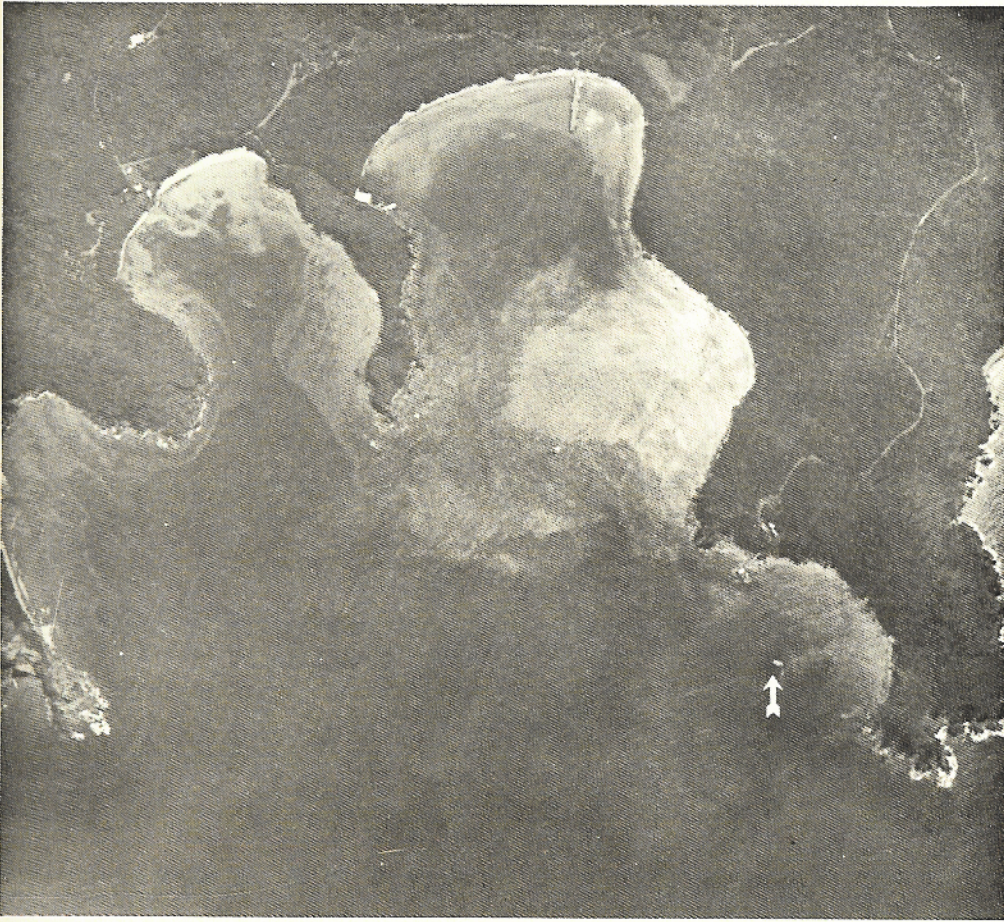
Vista aérea de la bahía Lameshur mostrando el lugar del Tektite sobre un arrecife de las Islas Vírgenes del Caribe.

diferentes tanto en el tipo de actividad como la intensidad de la misma. Por ejemplo se demostró que la actividad de los congrios estaba íntimamente ligada con la intensidad de la luz del medio ambiente, siendo mayor su actividad mientras mayor era la luminosidad y viceversa. Por otro lado, los peces trompeta iban en busca de su alimento durante el amanecer y atardecer, pero sólo lo tomaban o ingerían a pleno día. También se pudo observar que los peces mariposas comían esponjas a determinadas intensidades de luz, a pesar de que estos invertebrados constituyen el 97 % de su alimentación.