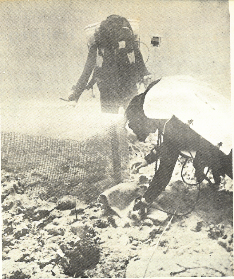
Dos acuanautas del Tektite II examinan una jaula, en la que han sido excluidos los peces herbívoros.

No cabe duda de que el lugar escogido por el equipo científico poseía una serie de condiciones